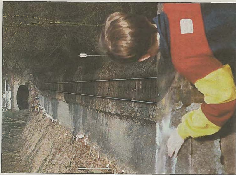
BAHN FREI: Die Odenwaldstrecke - hier zwischen Dieburger Straße und dem Ostbahnhof - erhält ihr zweites Gleis zurück. Das ermöglicht den Halbstundentakt nach Erbach und ist darüber hinaus für die Heag Anstoß zu weitreichenden Plänen im Darmstädter Nahverkehr. Zum Bericht.

Kein Problem, sagt Braun. Die Heag-Gleise in der Rheinstraße haben sowieso in einigen Jahren das Ende ihrer Halbtagelebensdauer erreicht und müssen ausgetauscht werden; bei dieser Gelegenheit ließe sich jeweils eine dritte Schiene einbauen, auf dem so entstandenen Dreischienengleis könnten sowohl Straßenbahnen wie Eisenbahntriebwagen Darmstadt durchqueren. „Wir ziehen da mit“, versichert Holub. Er hat sich gerade in Zwickau umgesehen; bei den Sachsen ist die Schienen-Utopie bereits Wirklichkeit, rollt die Eisenbahn „sozusagen auf deren Luiseplatz“. Für den Kombiverkehr hält die Industrie spezielle Leichtbau- und Nieder-